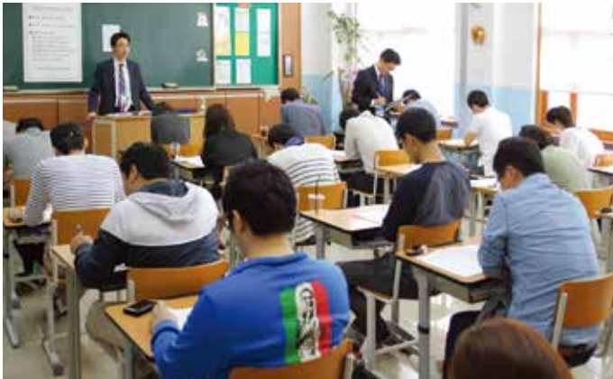
신한은행, 직무챔피언 운영

또한 공정하고 합리적인 성과보상을 위해 전 임직원을 대상으로 연 1회 정기 성과평가를 시행하고 있습니다. 평가항목은 업무수행의 결과인 업무성과와 이를 달성하기 위해 직원이 습득하고 개발해야하는 지식, 기술 및 행동양식인 역량으로 구성되며, 평가결과에 보수, 승진, 경력 개발, 이동·배치, 교육 훈련 등에 활용됩니다.