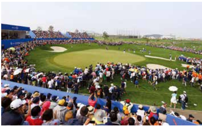
2015년 신한동해오픈 최종라운드

또한 신한동해오픈은 매년 꾸준히 사회공헌사업을 진행하고 있습니다. '희망나눔캠페인'은 신한동해오픈의 대표적 사회공헌 활동으로 대회를 찾은 관람객들에게 참된 나눔의 가치를 설명하고 동참을 유도하고 있습니다. 관람객들은 스크래치 카드 형태의 '희망나눔쿠폰'을 구입해 사회공헌에 동참하고, 신한금융그룹은 매칭 형태로 기금을 조성해 전액 기부합니다. 2015년 대회에서도 인천 사회복지협의회와 한국백혈병어린이재단에 기부금을 전달했습니다.