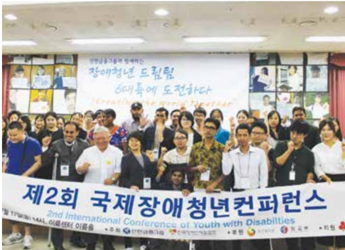
장애청년드림팀, 제2회 국제장애컨퍼런스

신한금융그룹은 2005년부터 한국장애인재활협회와 함께 진행 중인 '장애청년드림팀 6대륙에 도전하다' 프로그램을 통해 장애청년들이 글로벌 리더로서의 역량을 함양할 수 있는 다양한 기회를 제공하고 있습니다. 해외 연수 형태로 진행되는 이 프로그램은 연수 테마 선정에서 방문기관 섭외, 교통 및 숙박에 이르는 전 과정을 장애청년이 직접 기획 및 실행하고 있습니다. 2015년까지 총 685명이 참여하여 국제 사회 협력, 문화, 교육, 빈곤 등 다양한 이슈를 경험하고 새로운 변화를 모색하였으며, 특히 올해는 한국, 뉴질랜드, 스웨덴, 영국, 미국의 장애이슈를 탐방하고 라오스의 장애현황 및 국제협력에 대해 연구하였습니다.