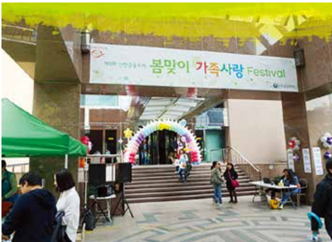
신한금융투자, 봄맞이 페스티벌

신한생명은 매년 IT 우수 협력회사를 선정하여 인증서 수여식을 진행하고, 협력회사 거래만족도 조사를 시행하여 우수 협력회사에 대한 지원방안을 지속적으로 확대할 계획입니다. 또한 2016년에는 기존의 상담사 근무만족도 개선 활동과 더불어 가족의 달 행사, 호프데이 운영 등 월별로 다양한 활동을 진행하고, 상담사 근무 환경 개선을 위한 전산, 업무 프로세스 등을 꾸준히 개선하여 실질적인 만족도 제고가 이루어질 수 있도록 노력할 것입니다.