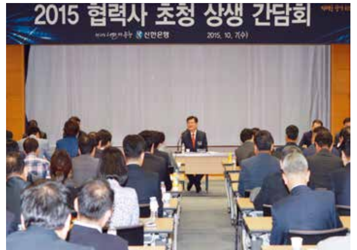
신한은행, 협력회사 초청 상생 간담회

신한은행은 협력회사의 불편사항과 개선 아이디어를 얻고자 전체 협력회사를 대상으로 매년 상생간담회를 개최하고, 간담회에서 건의된 내용은 경영활동에 반영하고 있습니다. 2015년 간담회에는 협력회사 대표 등 160여명이 참석하였으며, 간담회와 별도로 사회책임경영 인식 확대를 위한 교육을 함께 실시하였습니다. 더불어 협력회사의 불필요한 비용 절감을 위해 신규사업 제안 시 시제품에 대한 합리적 보상 및 전자계약을 통한 서류간소화 등을 추진하고 있으며, 우수 협력회사 대상 매출채권 담보 대출 및 핀테크 우수기술 보유 업체 대상 TCB 대출, 그리고 우수 협력회사 직원 대상 엘리트론 등의 혜택을 제공하고 있습니다. 특히 2015년에는 거래 중인 ICT협력회사 중 85개사를 별도 심사·선정하여 기술금융(TCB 대출)을 취급함으로써 은행과 협력회사간의 상생프로그램을 실천하였습니다.