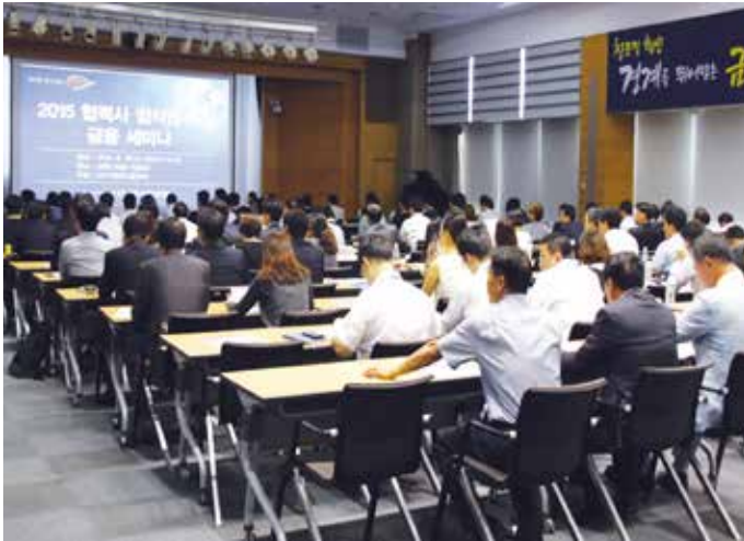
신한은행, 협력회사 임직원 초청 금융세미나

신한생명은 드림콜센터 상담사의 업무 스트레스 경감을 위해 감성공연 ‘힐링페스타’를 개최하고, 유명 강사를 초청한 힐링 강연을 실시하는 등 다양한 지원활동으로 상담사들의 긍정적인 호응을 얻고 있습니다. 전문상담사를 배치하여 상담사들의 심리적인 고충 완화 및 소속감 고취에 기여하고 있으며, 2015년 기준 458건의 상담을 진행하였습니다. 이 외에도 매년 전 상담사를 대상으로 근무지에 대한 설문조사를 실시하여 근무 여건에 대한 지속적인 개선을 추진하고 있으며, 특히 모바일 조사 방식을 새롭게 도입하여 참여 방식의 편의를 제고하였습니다.